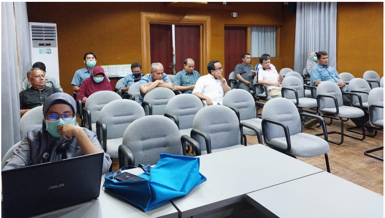
Gambar 3. Pembukaan Rapat AMI th 2022