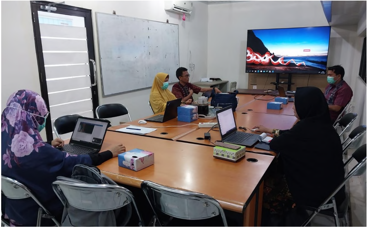
Gambar 6. Kegiatan Audit di Prodi DIV TMM