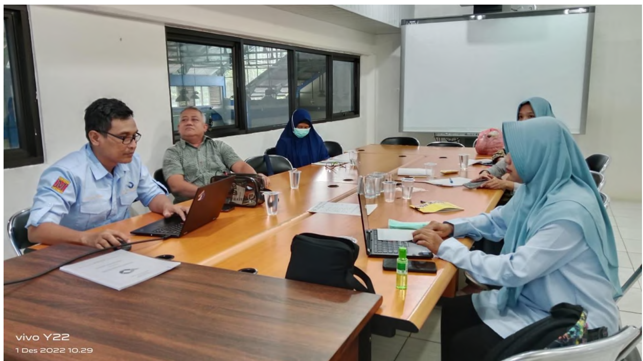
Gambar 1. Rapat dengan TIM AMI