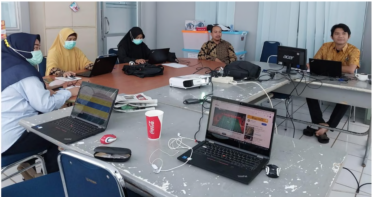
Gambar 5. Kegiatan Audit di Prodi DIII Elektronika