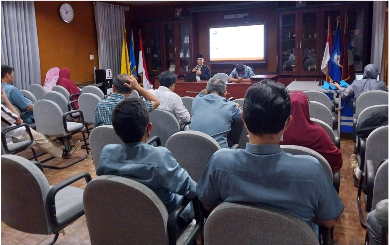
Gambar 4. Rpat Pembukaan AMI th 2022